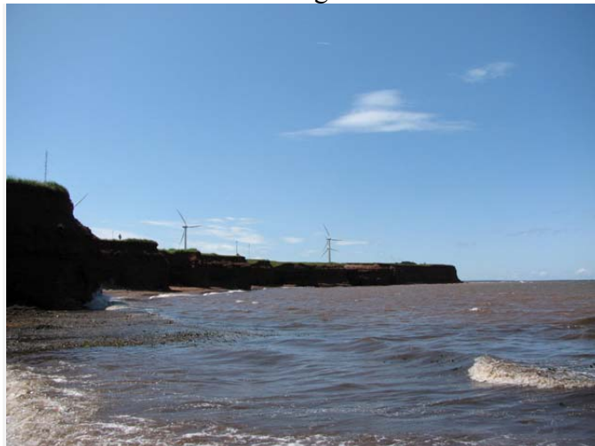
Un autre panorama époustouflant du littoral de l'Î.-P.-É.