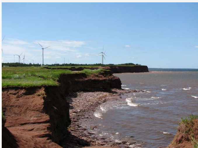
Éoliennes le long de la côte de l'Î.-P.-É.